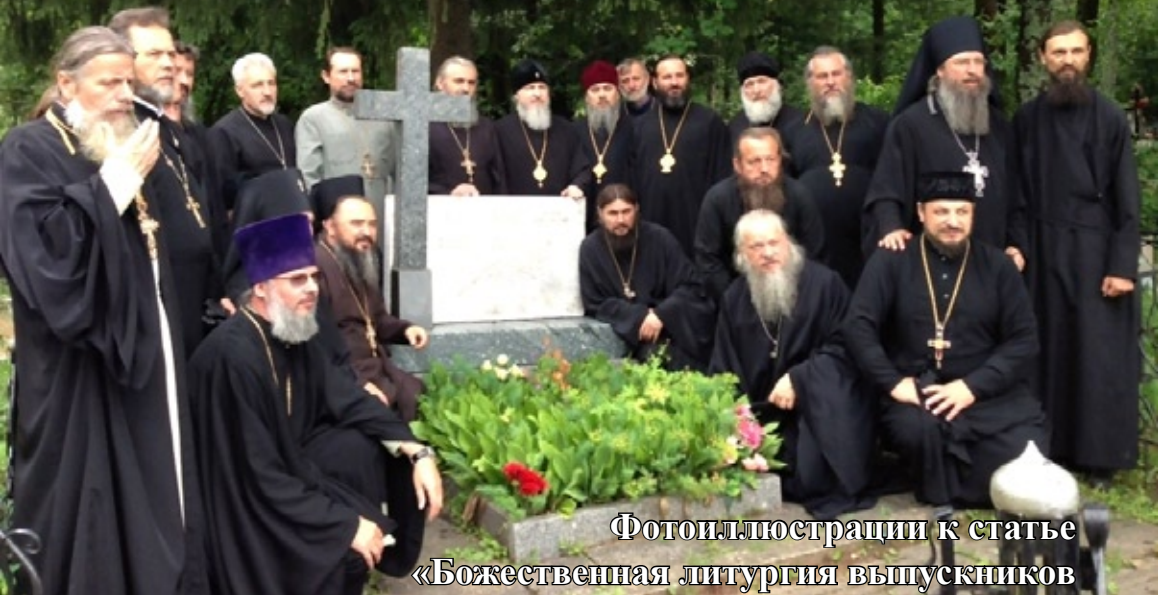
Фотоиллюстрации к статье «Божественная литургия выпускников Московской духовной семинарии 1988 года»