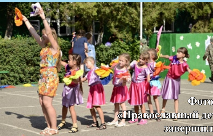
Фотоиллюстрации к статье «Православный детский лагерь «Радуга» завершил свою работу» (стр. 17)