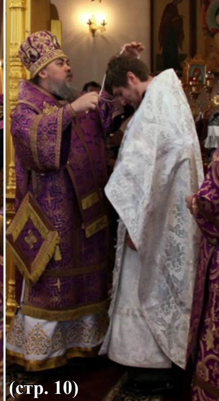
Фотоиллюстрации к статье «Под сводами храма звучало “Аксиос!”» (стр. 10)