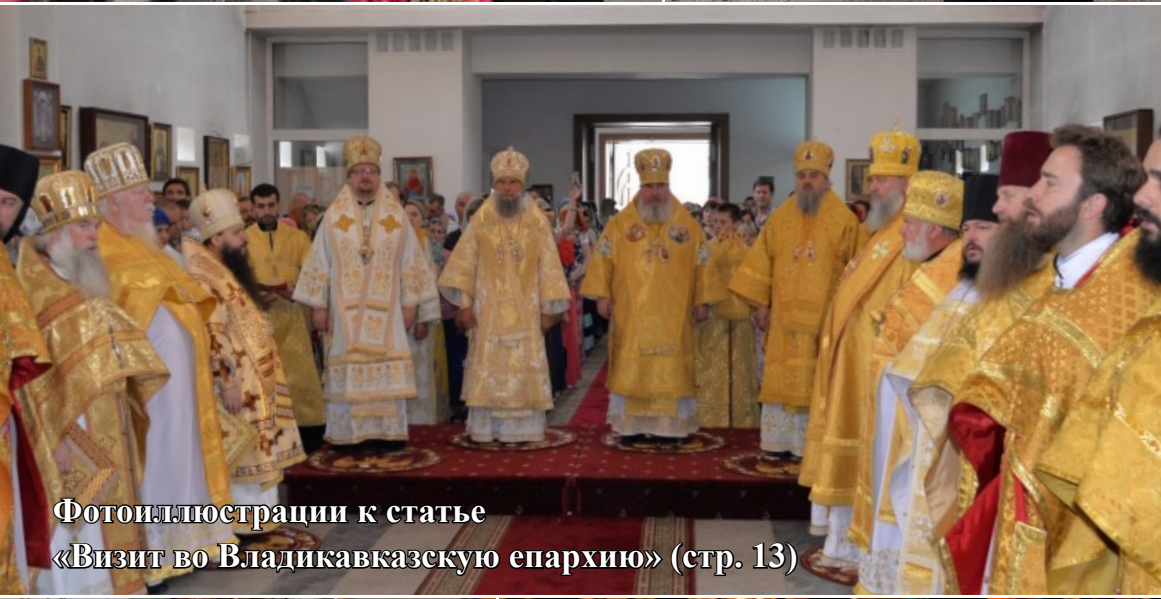
Фотоиллюстрации к статье «Визит во Владикавказскую епархию» (стр. 13)