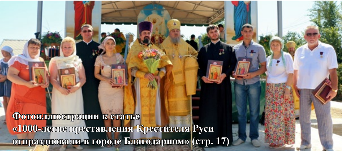
Фотоиллюстрации к статье «1000-летие преставления Крестителя Руси отпраздновали в городе Благодарном» (стр. 17)