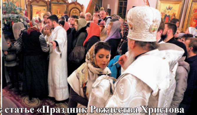
Фотоиллюстрации к статье «Праздник Рождества Христова в Георгиевском храме города Георгиевска» (стр. 13)