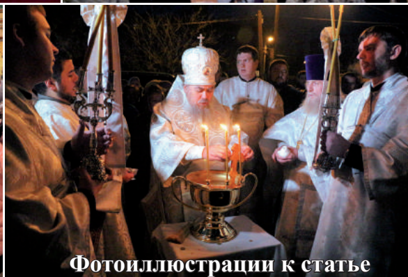
Фотоиллюстрации к статье «Архиерей возглавил Крещенские богослужения» (стр. 17)