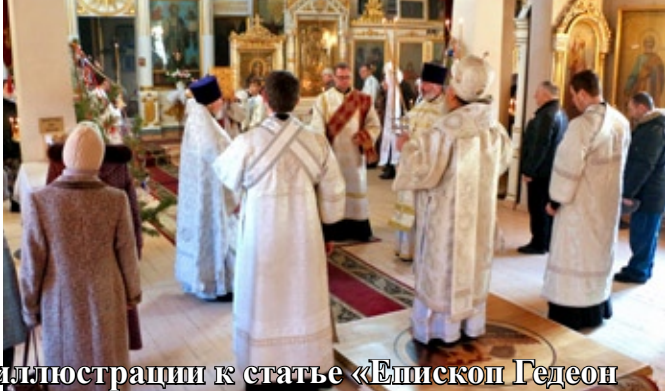
Фотоиллюстрации к статье «Епископ Гедеон возглавил Рождественские богослужения» (стр. 8)