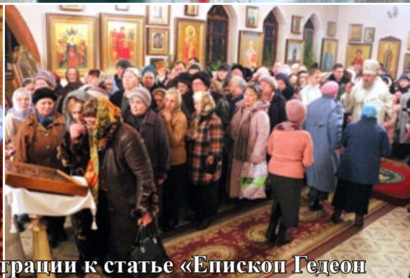
Фотоиллюстрации к статье «Епископ Гедеон возглавил Крещенские богослужения» (стр. 11)