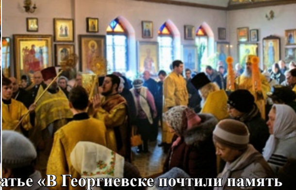
Фотоиллюстрации к статье «В Георгиевске почтили память новомучеников и исповедников Русской Церкви» (стр. 6)