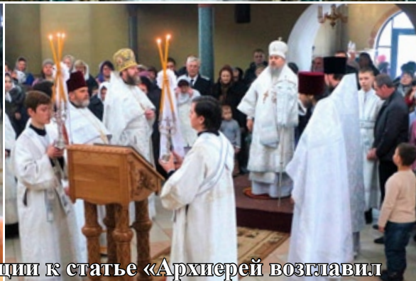
Фотоиллюстрации к статье «Архиерей возглавил праздничную Литургию в Воскресенском храме города Будённовска и детский праздник в православной школе» (стр. 7)