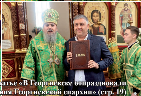
Фотоиллюстрации к статье «В Георгиевске отпраздновали пятилетие образования Георгиевской епархии» (стр. 19)