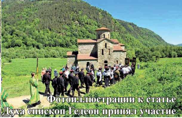
Фотоиллюстрации к статье «В День Святого Духа епископ Гелеон принял участие в Литургии в древнем аланском храме X века» (стр. 13)