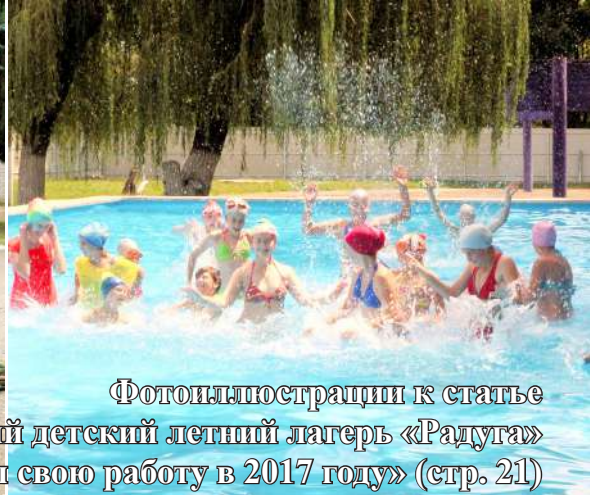
Фотоиллюстрации к статье «Епархиальный детский летний лагерь «Радуга» завершил свою работу в 2017 году» (стр. 21)