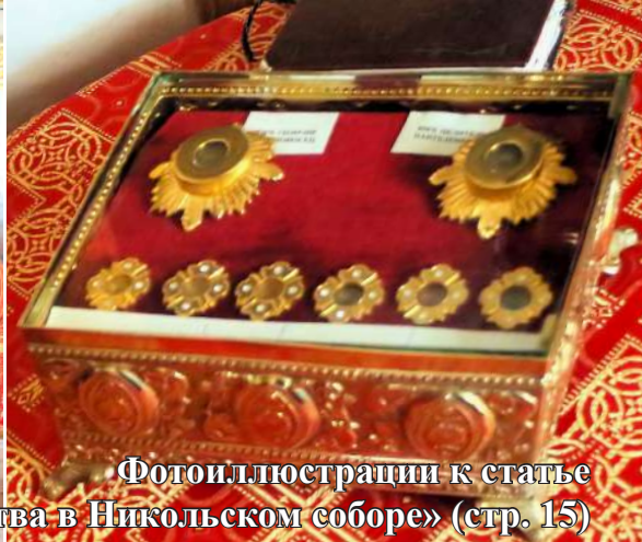
Фотоиллюстрации к статье «Престольные торжества в Никольском соборе» (стр. 15)