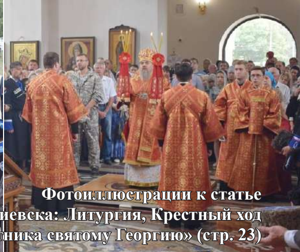
Фотоиллюстрации к статье «День города Георгиевска: Литургия, Крестный ход и освящение памятника святому Георгию» (стр. 23)