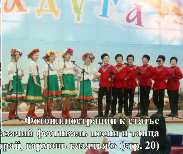
Фотоиллюстрации к статье «IV Епархиальный казачий фестиваль песни и танца «Играй, гармонь казачья!» (стр. 20)