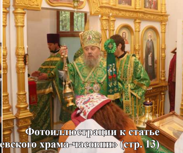
Фотоиллюстрации к статье «Престольный праздник Сергиевского храма-часовни» (стр. 13)