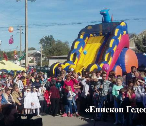
Фотоиллюстрации к статье «Епископ Гедеон принял участие в праздновании Дня села Прасковья» (стр. 9)