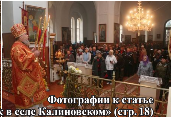
Фотографии к статье «Храмовый праздник в селе Калиновском» (стр. 18)