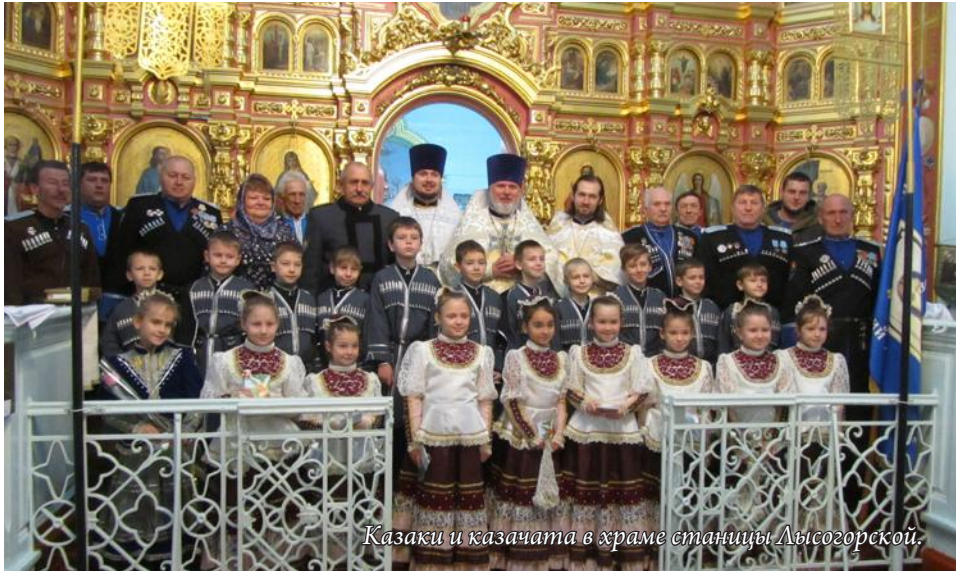
Казачи и казачата в храме станции Дысогорской.