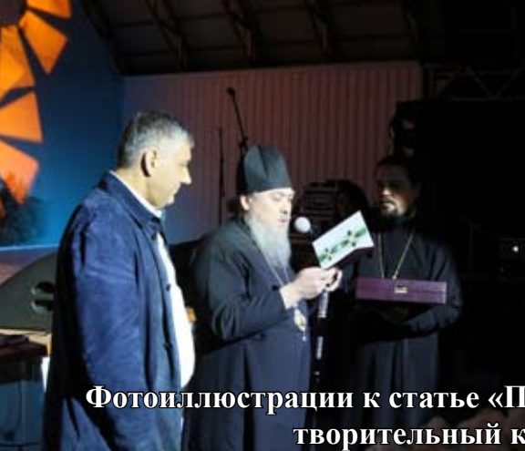
Фотоиллюстрации к статье «Патриотический флешмоб, благотворительный концерт и игры с огнём» (стр. 14)