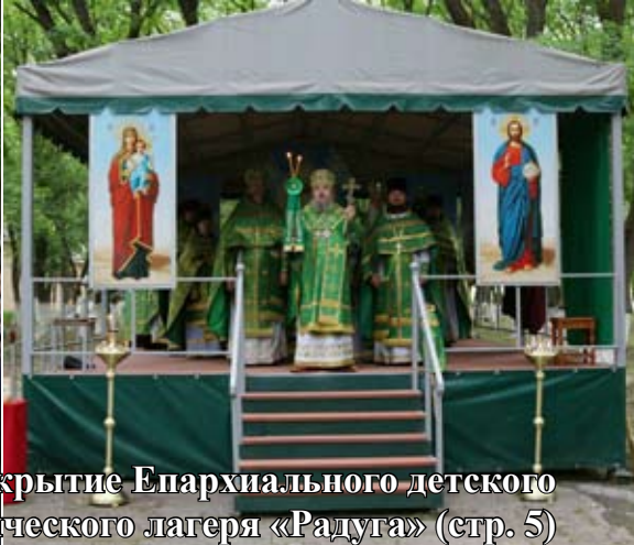
Фотоиллюстрации к статье «Открытие Епархиального детского духовно-патриотического лагеря «Радуга» (стр. 5)