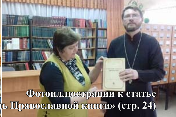
Фотоиллюстрации к статье «В Епархии отпраздновали день Православной книги» (стр. 24)