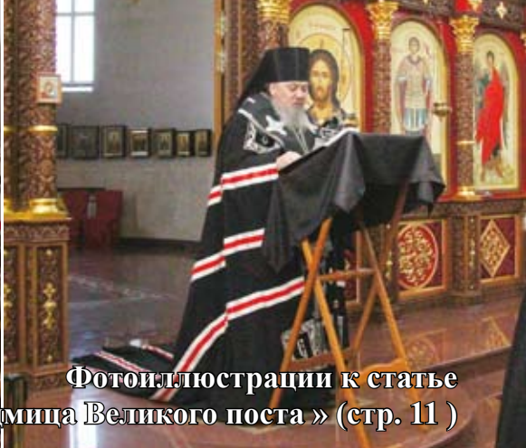
Фотоиллюстрации к статье «Первая седмица Великого поста» (стр. 11)