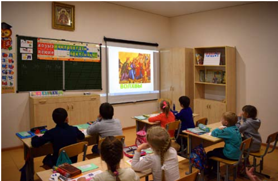
На занятиях ребята узнают о сотворении мира Всемогущим Богом и о том, что всё живое на Земле существует по Его законам.

собия, иллюстрации, игры. Дети обучаются счёту, знакомятся с понятиями «больше», «меньше», «чётные и нечётные цифры» и т. п. При этом используются различные наглядные пособия, счётные палочки, и природные материалы. Воспитанники учатся распознавать геометрические фигуры — круг, квадрат, треугольник, осваивают мерные величины — метр, сантиметр, килограмм, грамм и т. д. На занятиях дошкольники не только осваивают показательную арифметику, но и производят арифметические действия в уме, получают навык находить и сопоставлять предметы в быту, на улице и в природе. К окончанию обучаю-