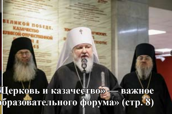
Фотоиллюстрации к статье «Церковь и казачество» — важное направление работы образовательного форума (стр. 8)