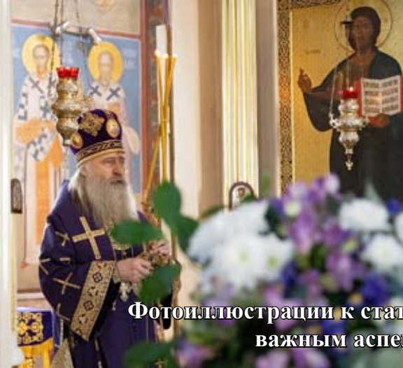
Фотоиллюстрации к статье «Круглый стол, посвящённый важным аспектам монашеской жизни» (стр. 8)