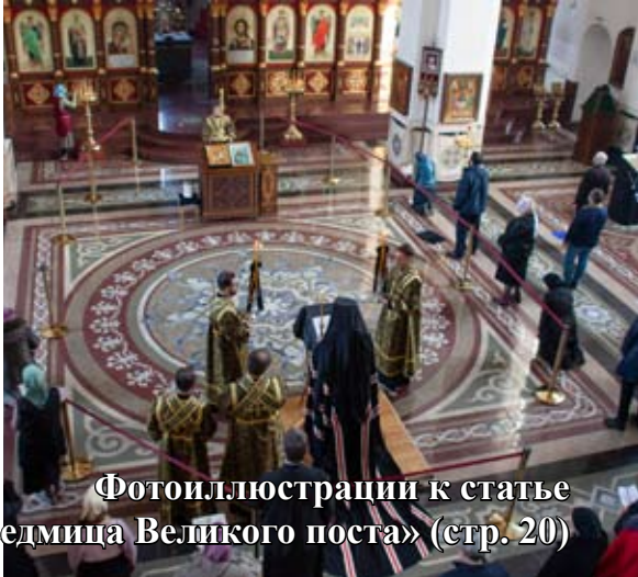
Фотоиллюстрации к статье «Первая седмица Великого поста» (стр. 20)