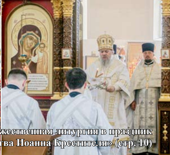
Фотоиллюстрации к статье «Божественная литургия в праздник Рождества Иоанна Крестителя» (стр. 10)