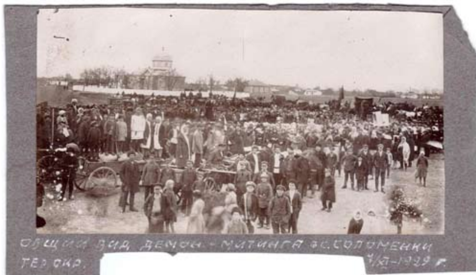
Фотография из ГБУК СК «Ставропольский государственный историко-культурный и природно-ландшафтный музей-заповедник имени Г. Н. Прозрителева и Г. К. Пправе»

В Ставропольском государственном музее им. Г. Н. Прозрителева и Г. К. Пправе имеется фотография с надписью: «Общий вид демон. [страции]-митинга в с. Соломенки Тер. окр. 7/XI-1929 г.». К сожалению