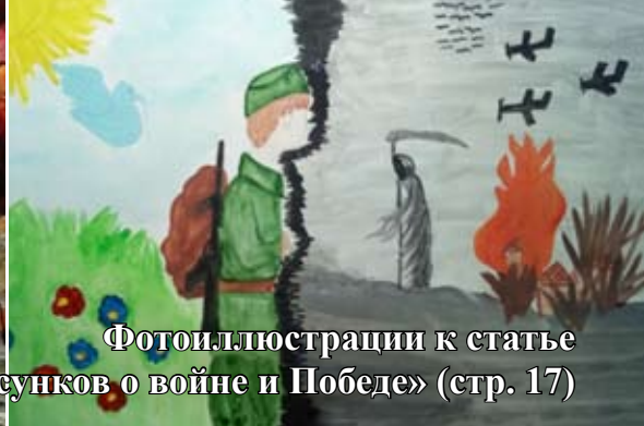
Фотоиллюстрации к статье «Выставка детских рисунков о войне и Победе» (стр. 17)