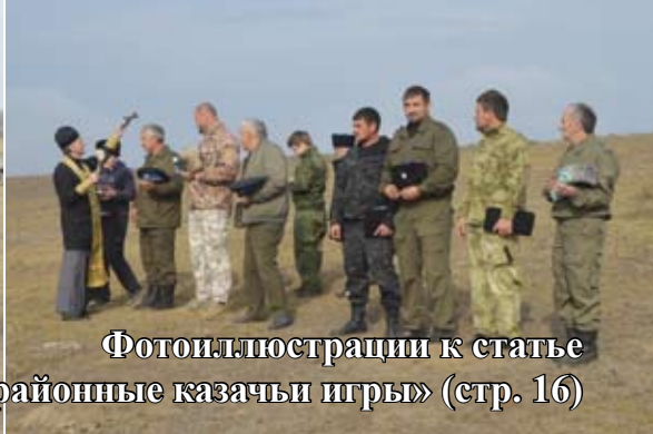
Фотоиллюстрации к статье «Степновские Епархиальные районные казачьи игры» (стр. 16)